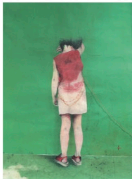
LUCAS WEINACHTER Cache toi #3 , 2016 Crayons de couleur, acrylique, fils de coton sur papier japon 48 x 43 cm