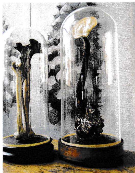
COMPOSITIONS VÉGÉTALES SOUS GLOBES.

PIÈCES EN COLLECTIONS PUBLIQUES : MUSÉE BARROIS, BAR-LE-DUC. VILLE DE CORBEIL-ESSONNES.