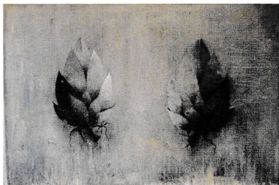
SANS TITRE, 146 x 97CM, ACRYLIQUE SUR PAPIER MAROUFLÉ.