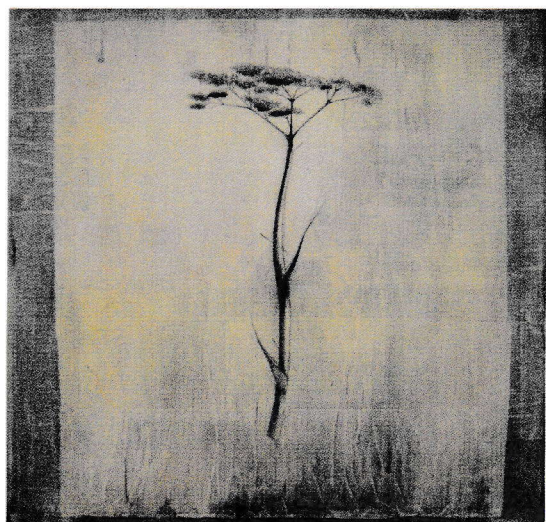
OMBELLIFÈRE, 80 x 80 CM, ACRYLIQUE SUR PAPIER MAROUFLÉ.